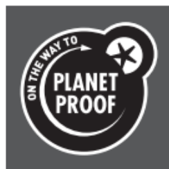
Zwart op donkere achtergrond