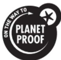
Zwart op witte achtergrond