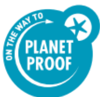
Petrolblauw op witte achtergrond

Gebruik bij voorkeur – zeker wanneer kleiner dan 20 mm breed – het originele, petrolblauwe logo op een witte ondergrond met witte omgeving.